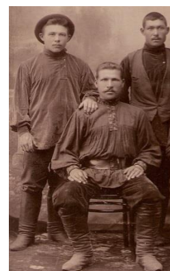
Крестьяне д. Большая Кура Фото 1910-1911 гг. [1, с. 72].