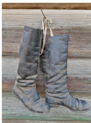
Хромовые сапоги. Л.А. Фото 2022 г.