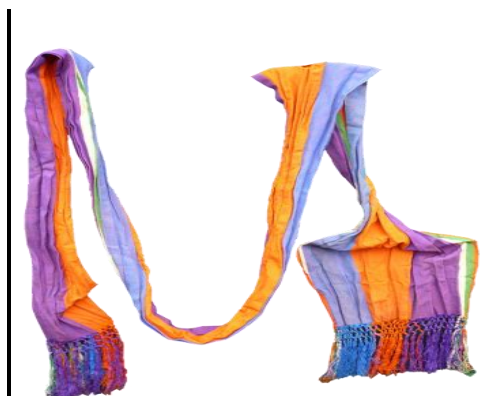
Старинный мужской кушак XIX века [1, с.71].