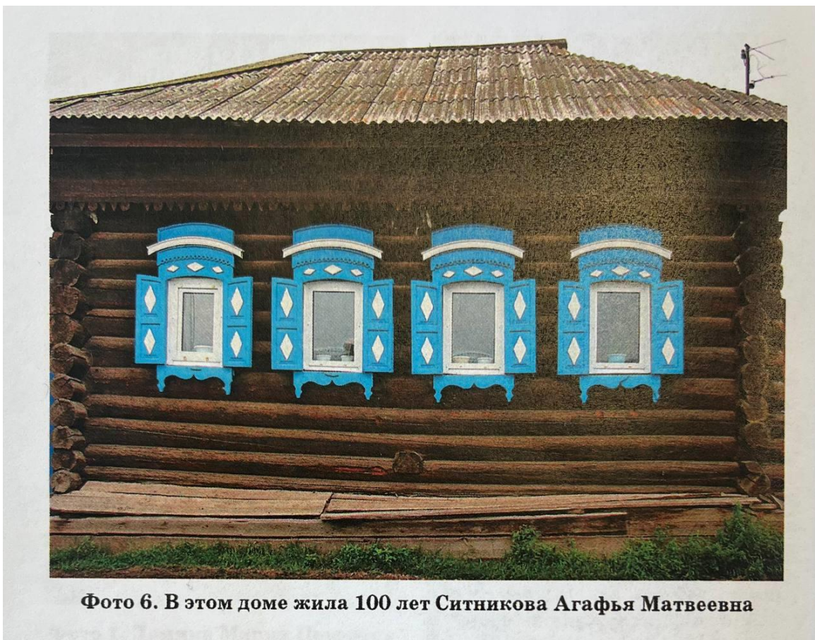
Фото 6. В этом доме жила 100 лет Ситникова Агафья Матвеевна