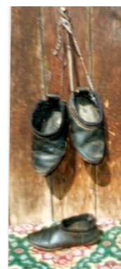
Старинный сарафан. Л.А. Фото 2001 г. Свадебная шаль 1916 год [1, с. 86]. Старинные чирки [1, с. 180].