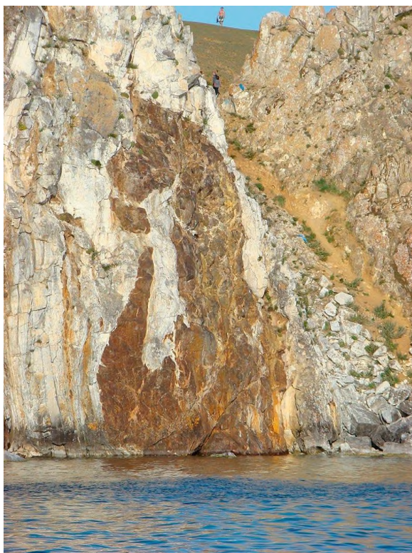
Озеро Байкал. Мыс Бурхан (Скала Шаманка) с изображением дракона.